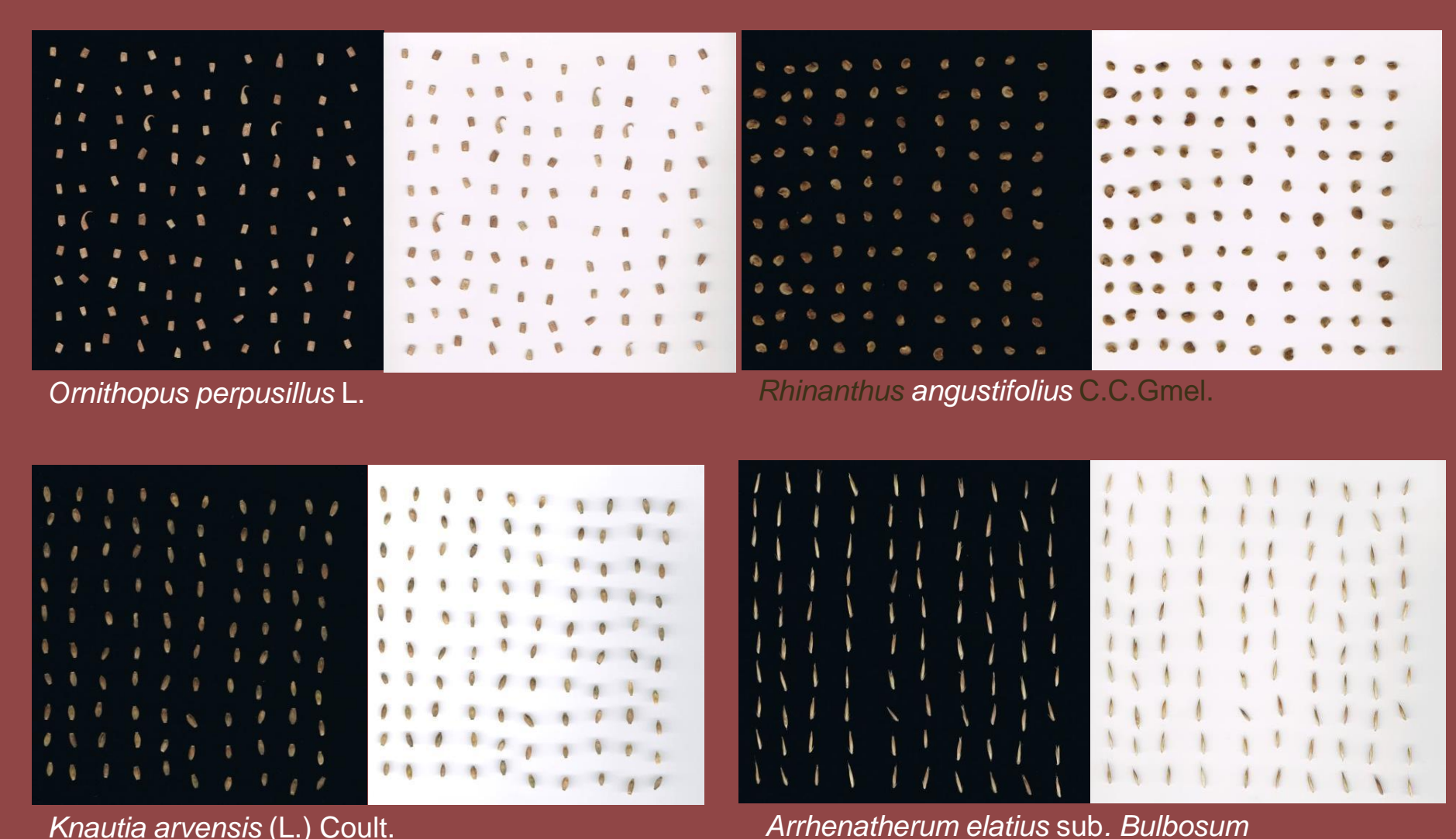
Figura 2. Resultados da taferfa GT5