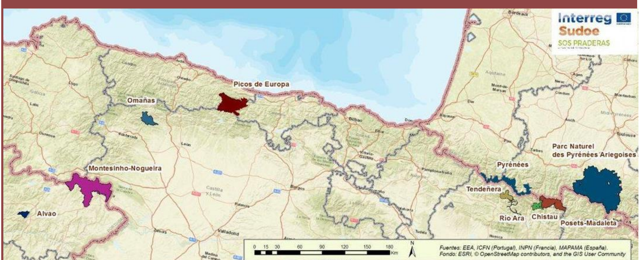
Figura 1. Zonas de intervenção, localizadas em Espanha, Portugal e França